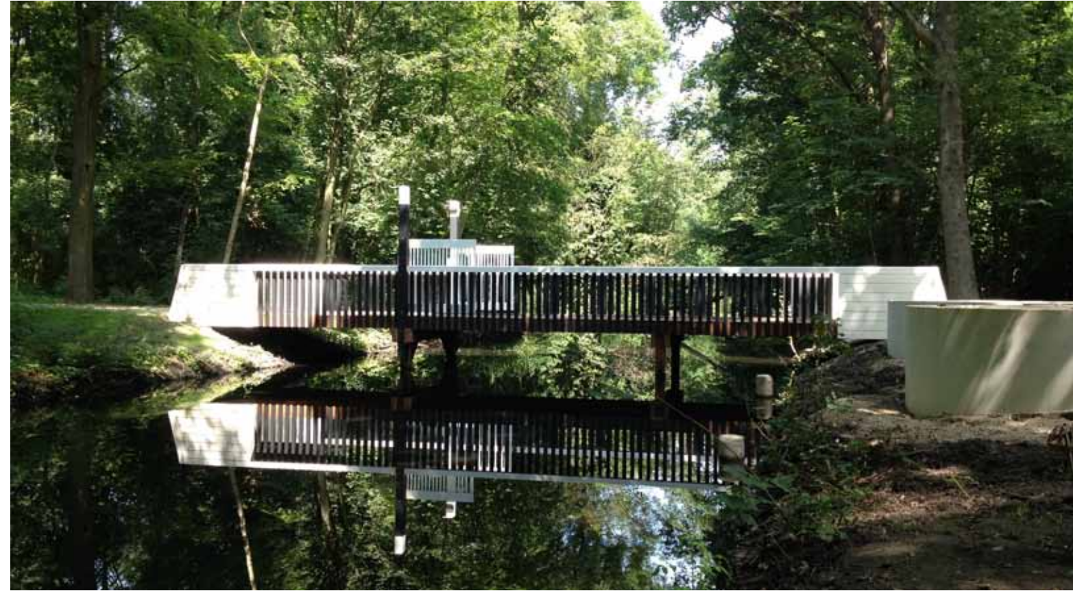
Amsterdamse Bos brug naar manege Nieuw Amstelland Amsterdam