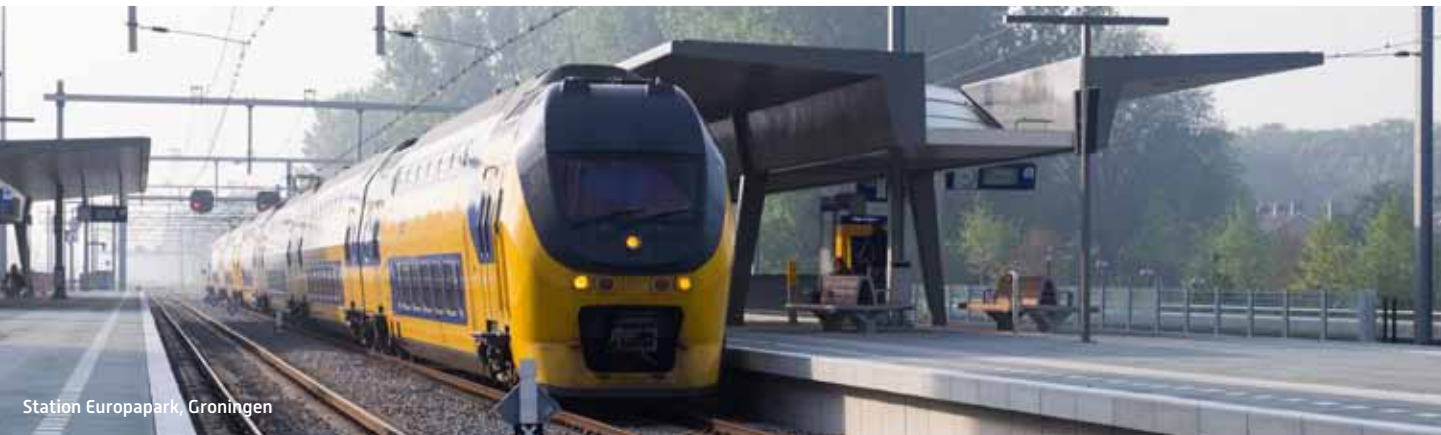
Station Europapark, Groningen