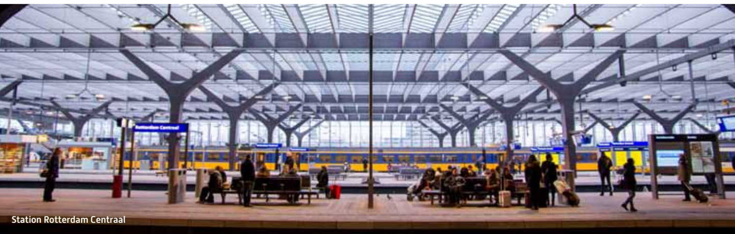
Station Rotterdam Centraal