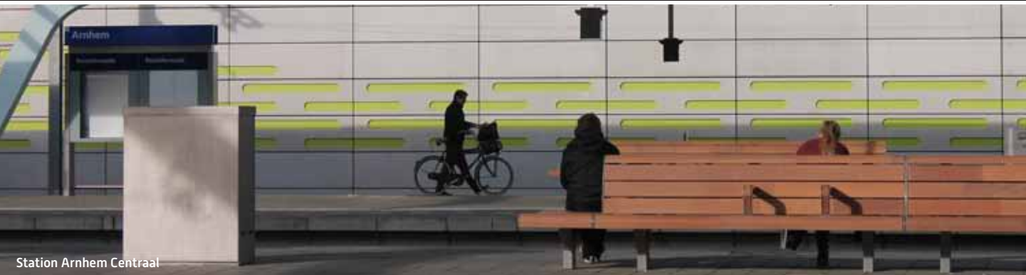
Station Arnhem Centraal